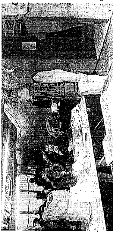
Lo stand con la trippa allestito dal gruppo Ana di Santo Stefano

di successo per la manifestazione, anche se i conti finali saranno fatti solo oggi. Molto apprezzato, tra gli altri, come sempre il chiosco detto “delle trippe”, quello organizzato ogni anno dagli alpini dell'Ana di Santo Stefano: con grande bravura, hanno trasformato la loro sede di