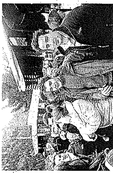
Anche tanti giovani tra le bancarelle

a una torze mune di Valle ricorderà con ermonie i Ca- le guerre. La onia, che si enas alle ore i Santa Messa la deposizio- na d'alloro al dei Caduti. La monia si svol- alle ore 11, ed la celebrazio- a Messa al ter- ale ci sarà l'o- duti ricordati nito ubicato di icipio. (v.d.) Aurono “Ice novità dell'in- 2008. “Ice proposta per del palagiac- o, con un pro- tività già def- di apertura o è dalle 14 al- colodi al saba- e 12 e dalle 14 omenica; pos- cesso molto rante il perio- dal 26 dicem- ato la struttu- erta anche al- 21 alle 23. Pat- turno costerà noleggio dei , un abbona- turni (senza o, un abbona- turni riserva-