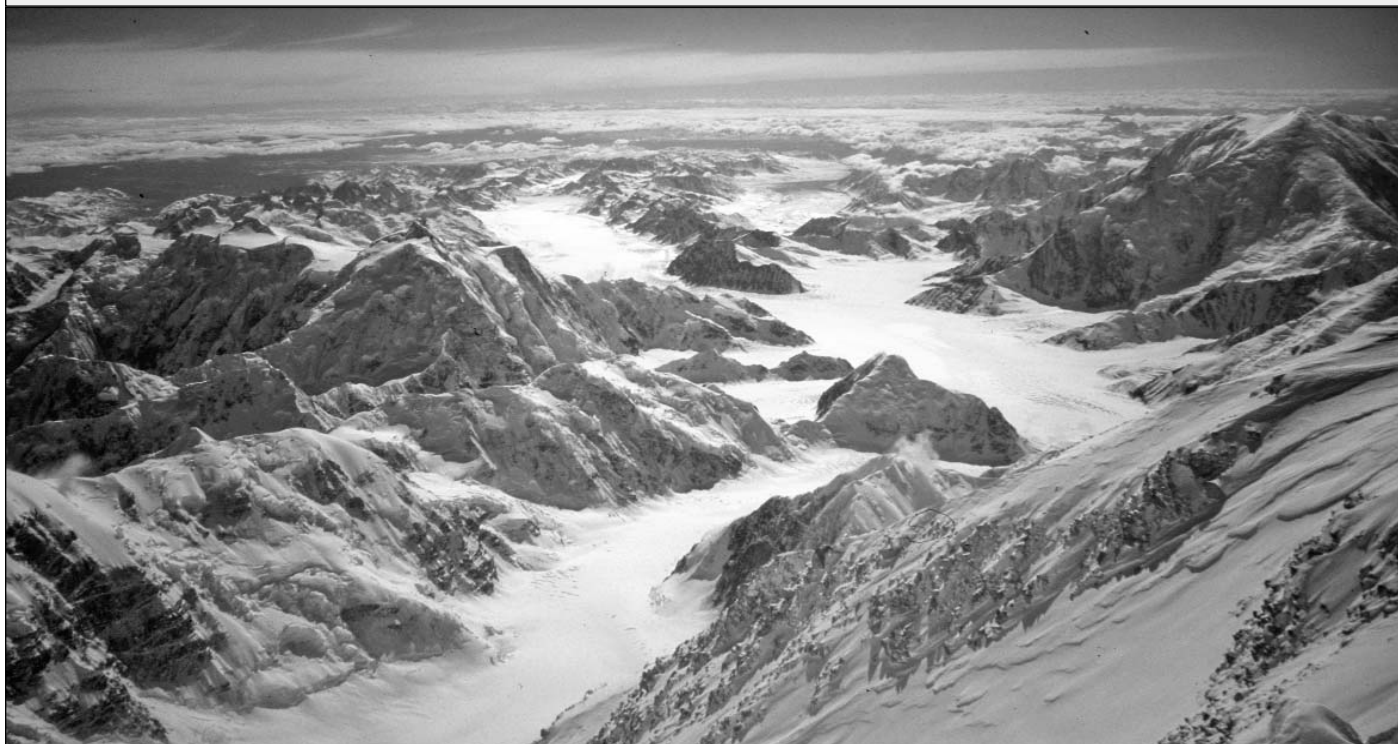
Veduta, dalla cima del McKinley, della vallata del ghiacciaio Kahiltna alla base del quale è posta la pista d'atterraggio

da "Eolo" l'informazione vola da te - ottobre 2005